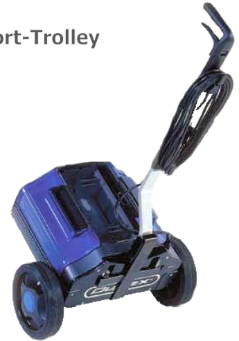
Transport-Trolley D340 D420 D620

Zum Reinigen der Maschine niemals fließendes Wasser oder einen Hochdruckreiniger verwenden!