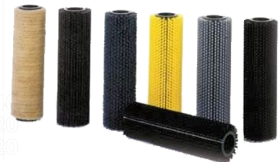
D340 D420 D620