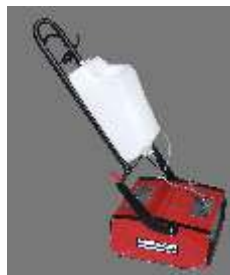
Zusatztank 8 Liter

Fliesen Teppich Parkett Linoleum Holz Terracotta Marmor Keramik