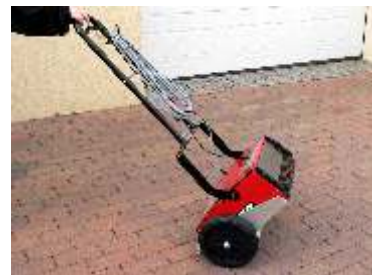
Fahrwagen für alle Modelle