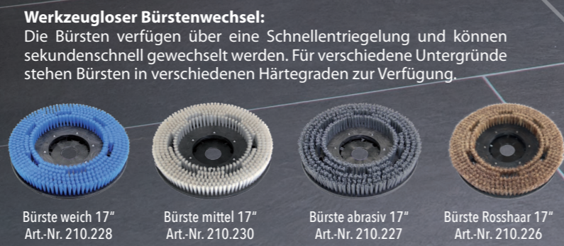
Bürste weich 17" Art.-Nr. 210.228 Bürste mittel 17" Art.-Nr. 210.230 Bürste abrasiv 17" Art.-Nr. 210.227 Bürste Rosshaar 17" Art.-Nr. 210.226

Optional: Pad-Treibteller und Pads in verschiedenen Härtegraden.