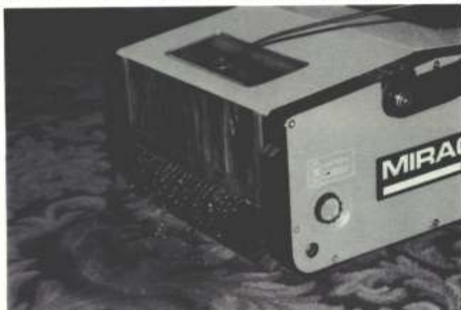
Aus kleinen Düsen kann Wasser auf den Teppichboden gesprüht werden. Im Normalfall reicht das für die Reinigung.

Eine Sonderstellung nimmt die Bürst-Walzenmaschine bei der Teppichbodenreinigung ein. Sie ist kein Ersatz für die klassische Grundreinigung (erst shamponieren, dann sprühextrahieren), obwohl ohne Aufnahmebehälter auch shamponiert werden kann. Vielmehr wird Zwischenreinigung (feucht oder mit Pulver) in bestimmten Intervallen zum Bürstsaugen/Saugen