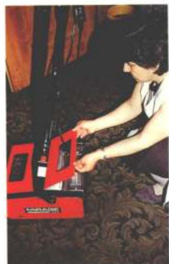
Leicht zu handhaben sind die Maschinen aus Bergen Enkheim - hier der Tank für die Schmutzflotte.

nem Dampfgerät, verschiedene Sprühextraktionen ... ohne Wasser. Die Kosten