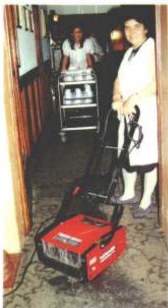
Leichte Arbeit – Das Krone-Personal verwendet die neue Maschine zur Reinigung des Teppichs und setzt sie überdies als Staubsauger ein.