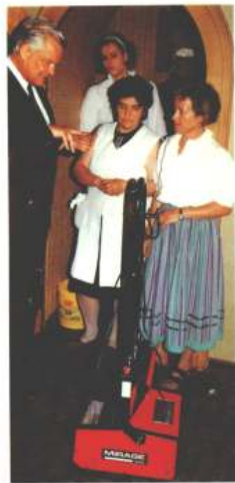
Die Krone-Mitarbeiter lassen sich das Prinzip der gegenläufig rotierenden Walzen erklären, die den Teppichboden von „Grund auf“ reinigen.