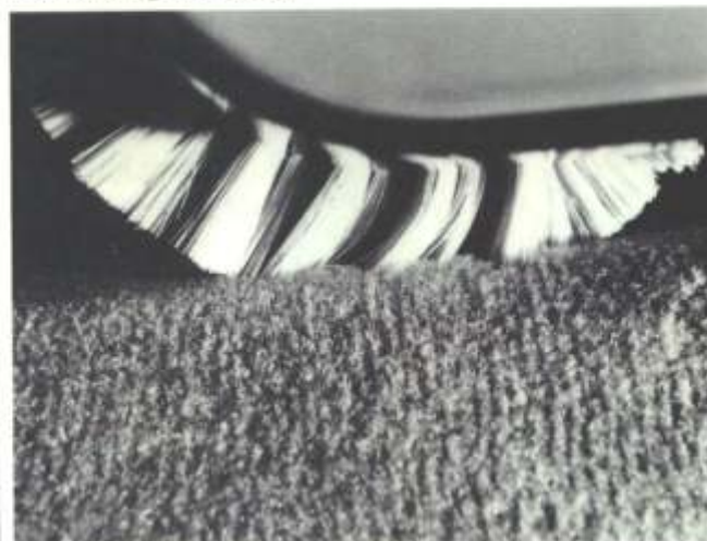
Tief greifen die Bürstenwalzen in den Teppichboden.

durchgeführt. Floriger Boden wird „vertikuttiert“, d. h. Verfilzung vorgebeugt, der Flor aufgerichtet, die Teppichfaser entwirrt, tiefliegender Schmutz gebunden und ausgebürstet, Geruchsbildung vermieden.