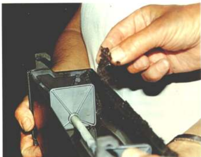
Deutlich zu erkennen: Der Schmutz den die Mirage nach dem Kleiderbürsten-Prinzip aus dem Teppichboden nach jedem Arbeitsgang herausbefördert hat.

nem Dampfgerät, verschiedene Sprühextraktionen ... ohne Wasser. Die Kosten