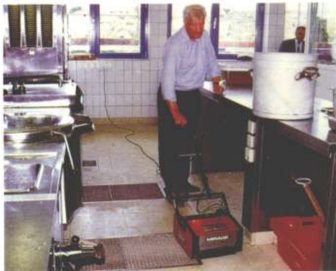
Konstruiert für moderne Küchen mit hängenden Kochelementen: Die Mirage-Maschinen von Karl Heinz Nothacker, die für Problemböden eine ideale Lösung darstellen.