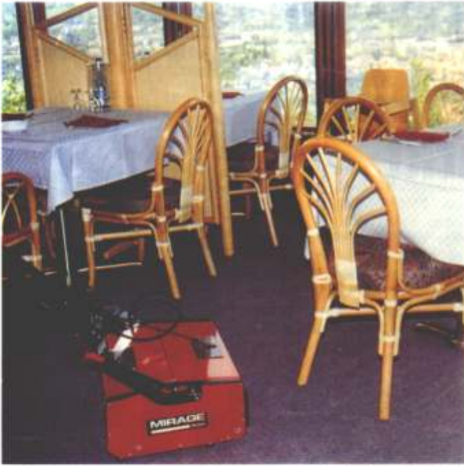
Vielseitige Mirage: Ob rutschfeste Fliese, Parkettboden, Steinboden oder wie hier (in der Autobahnraststätte Würzburg) auf Teppichboden können die Geräte problemlos eingesetzt werden und bringen hervorragende Reinigungsergebnisse.

reste, Knochensplitter, Sand Split) in einen separaten Auffangbehälter transportiert, der seinerseits leicht zu entsorgen ist. Für eine Reinigung von profilierten Fliesen scheidet beispielsweise das üblicherweise manuell durchgeführte Naßwischen als Reinigungsverfahren aus, weil der Schmutz aufgrund der Profilierung in Ecken, Kanten, an Höhen und Vertiefungen zurückbleiben würde. Ein Einsatz von Einscheiben-Maschinen ist nicht gegeben, da aufgrund der Konstruktion der Maschine sie auf solchen Böden nicht führbar