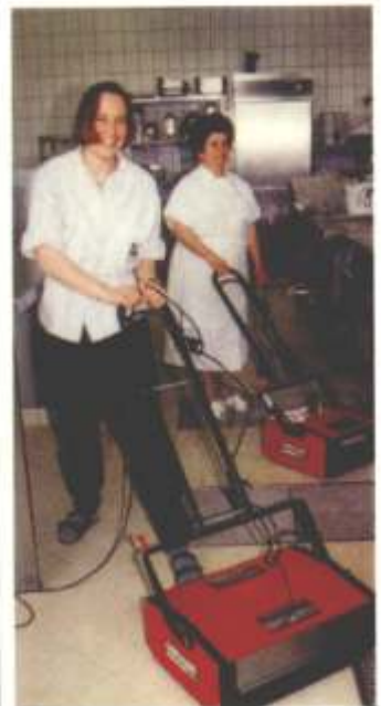
Testfahrt in der Raststättenküche: In der Praxis bewähren sich die Mirage-Maschinen mit den kontrarotierenden Bürstenwalzen. Die Mirage-Modelle erhalten Bestnoten vom Bedienungspersonal.

hen Wirkungsgrad erzielt. Mit der richtigen Kombination von Maschinen, Borstenhärte und eventueller Chemie ist es möglich, fast alle in der Praxis vorkommenden, verlegten Bodenbelagsarten (wie Glattböden aus PVC/Linoleum, Marmor, Stein, Holz, Parkett, Textilbeläge wie Teppichböden) richtig zu reinigen und einzupflegen. Es hat sich gezeigt, daß solche Maschinen von Vorteil sind, die über einen Behälter für die Aufnahme von Frischwasser, eventueller Chemie und über einen anderen Behälter zur Aufnahme von Schmutzwasser verfügen. Als wesentliches Kriterium gilt, daß sich zwischen den jeweiligen Bürstwalzen ein schräg angeordnetes und separat angetriebenes Förderband (Kehrschaufelprinzip) befindet, das den von den Bürsten gelösten Bodenschmutz (auch größere Teile wie Kartoffel-